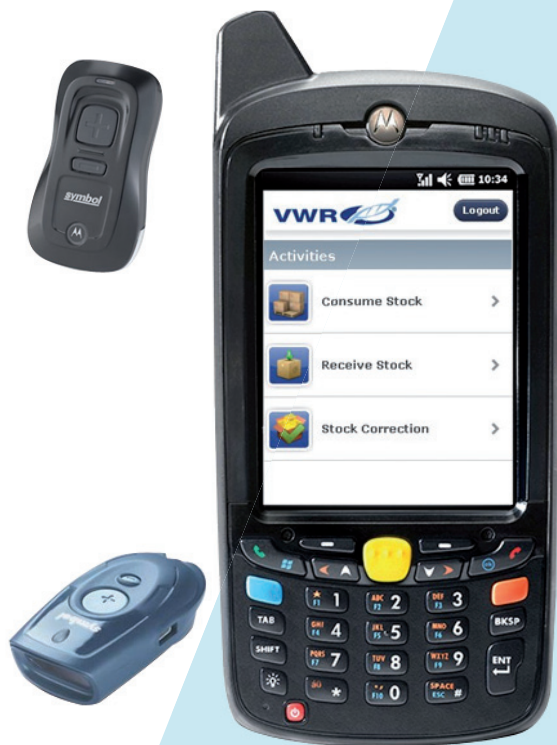
Mobile scanning solution(s)

Du kan nøjes med én enkelt prisbillig løsning til at understøtte dine daglige behov, hvilket ydermere minimerer behovet for træning i brug af systemet.